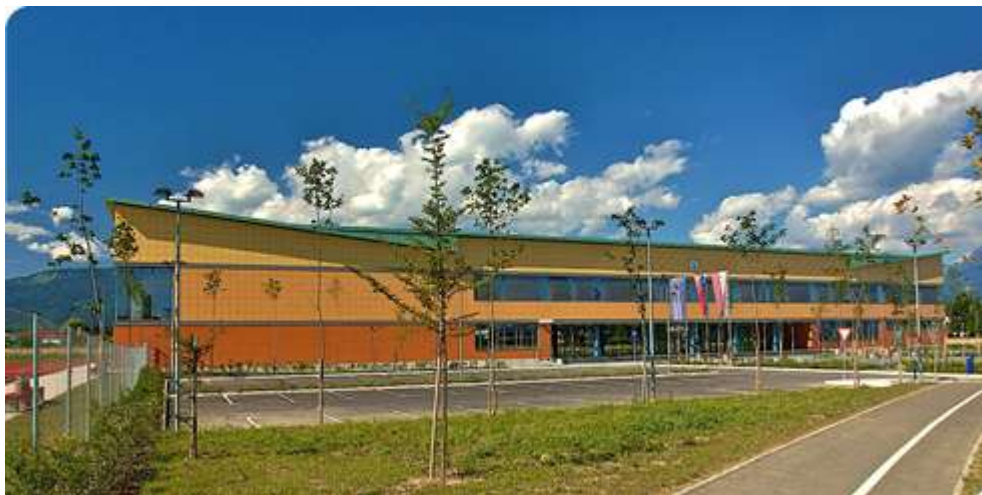
Gimnazija ESIC Kranj